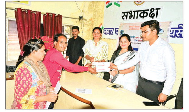
शिविर में श्रम योगी मानधन योजना का कार्ड बनाकर बीमा भी किए जा रहे हैं। जिसमें 60 साल की उम्र के बाद 3000 पेंशन मिलेगी।

इसमें 18 वर्ष से 40 वर्ष तक की आयु के लोग भी शामिल हैं। जिनकी न्यूनतम बीमा राशि 55 रुपए से लेकर 200 तक है। उनसे यह राशि जमा कराए जा रहे हैं। रजिस्ट्रेशन के लिए श्रमिकों के आधार कार्ड, बैंक