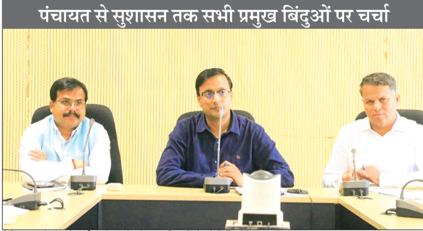
विदिशा। कलेक्टर ने समीक्षा बैठक के दौरान अधिकारियों को निर्देश देते हुए कलेक्टर अंशुल गुप्ता।

19 फरवरी को प्रमुख सचिव की अध्यक्षता में होने वाली वीडियो कॉन्फ्रेंस को लेकर कलेक्टर विभिन्न विभागों के अधिकारियों को समयसीमा में आवेदनों का निराकरण करने के निर्देश दिए हैं। इस दौरान विभिन्न विभागों के अधिकारी मौजूद रहे जबकि तहसीलों में नियुक्ति अधिकारियों से कलेक्टर ने वीडियो कॉन्फ्रेंस के माध्यम से चर्चा की है।