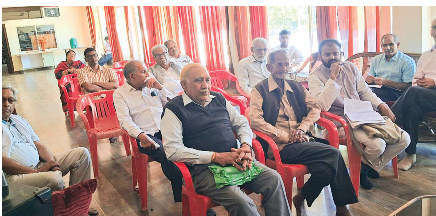
मानी जाती है। उन्होंने बताया कि 11वीं सदी में चिश्ती संप्रदाय के आगमन के साथ सूफी विचारधारा