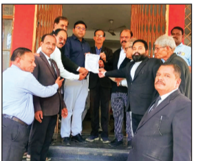
लगातार आपराधिक घटनाएं हो रही हैं, जिससे उनके जीवन की सुरक्षा पर गंभीर प्रश्नचिह्न खड़ा हो गया है। संघ ने बताया कि अधिवक्ताओं की सुरक्षा सुनिश्चित करने के लिए 'एडवोकेट प्रोटेक्शन एक्ट' लागू करने की मांग रखी।